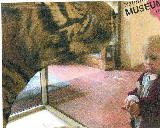
Naturhistorisches Museum MUSEUMSTESTER Pisa (I)

In den Herbstferien haben die Enkelinnen der Museumstesterin auf eigene Faust getestet: Sie waren in der Toskana und haben das Naturhistorische Museum der Universität Pisa am Fusse des Monte Pisano besucht. Kurz davor gab es rund um das Kloster grosse Waldbrände, in der Luft lag noch der beunruhigende Aschegegeruch. Gegen Feuer und andere Gefahren ist das ehemalige Kartäuserkloster gut geschützt durch hohe Mauern. Es ist beeindruckend weitläufig und elegant – und wie alle öffentlichen Gebäude in Italien in Renovation. Die Hälfte der Säle kann nicht besichtigt werden, der Rest war mehr als genug für vier Stunden Staunen und Entdecken. Alle Räume sind liebevoll eingerichtet, die riesige Sammlung ausgestopfter Säugetiere ist mehrheitlich 250 Jahre alt. Es gibt: Walskelette, eine Arche Noah, lebendige Fische, überzeugend echt aussehende Dinosaurier, wunderschöne Mineralien und einen Spazierweg durch 500 Millionen Jahre geologische Vergangenheit der Region. Am allerschönsten fanden die Kinder die «Wunderkammern», raumhohe Holzvitrinen aus dem 19. Jahrhundert, vollgestopft mit Sonderbarem aus aller Welt. ●